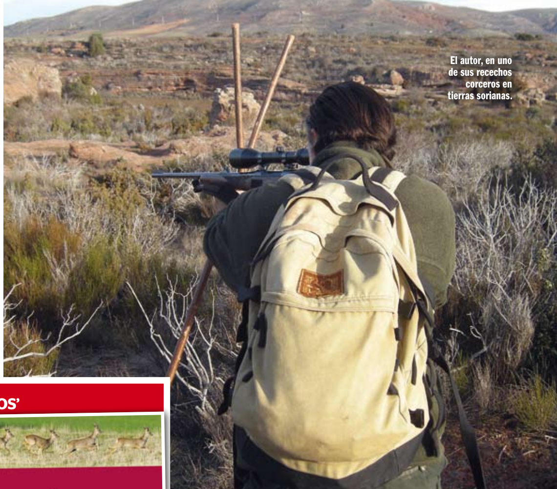
El autor, en uno de sus recechos corceros en tierras sorianas.